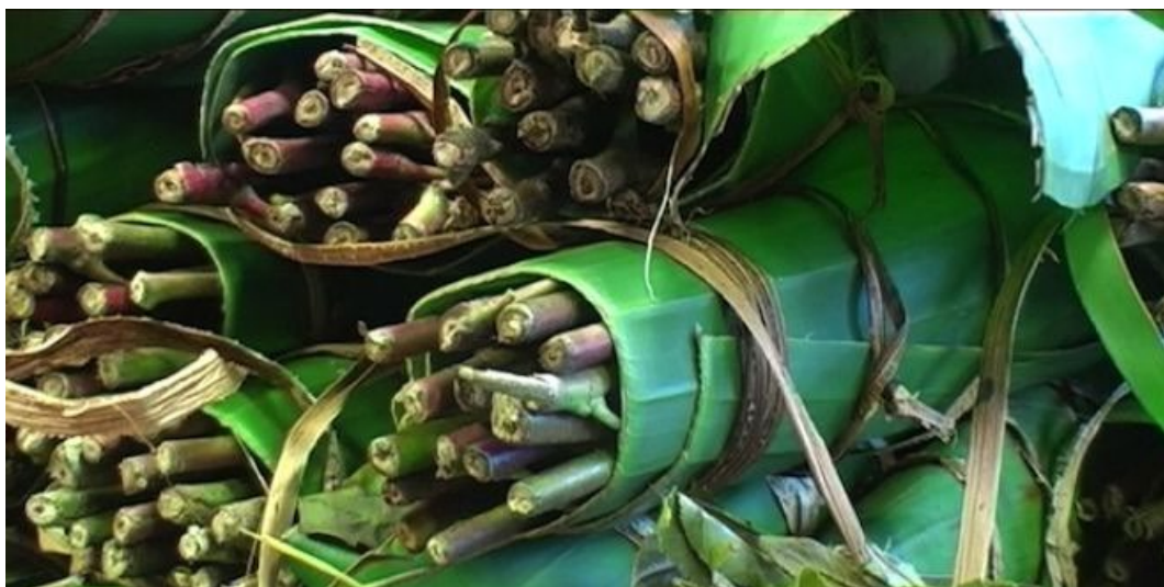
Dans une plantation de khat de Maua, au Kenya, en 2012.

Depuis plusieurs semaines, les saisies de khat se multiplient en France. Très peu consommée dans l'Hexagone, cette drogue, cultivée en Afrique de l'Est et au Yémen, transite sur le territoire français à destination de plusieurs pays anglo-saxons. L'interdiction de sa commercialisation aux Pays-Bas début janvier 2013 semble expliquer la très forte augmentation des saisies douanières dans le nord de la France depuis trois mois.