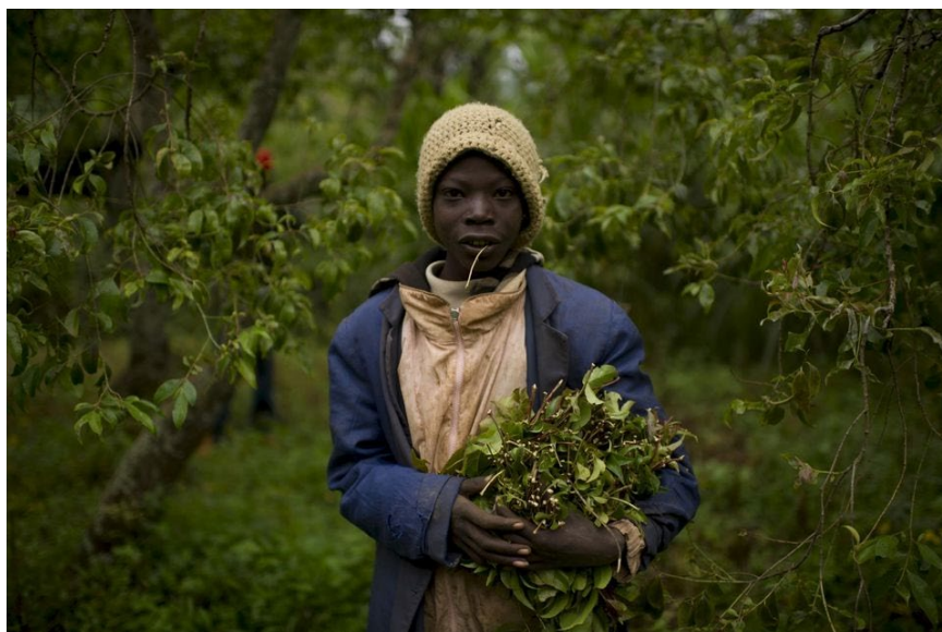
Dans une plantation de khat de Maua, au Kenya, en 2012.

Libération - Bastien Renouil, envoyé spécial à Mogadiscio (Somalie) et à Maua (Kenya) - 29 12 2016